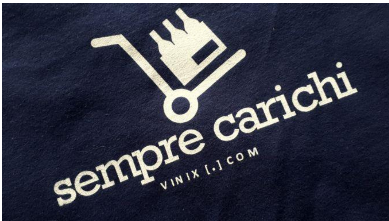
Sempre carichi! Il nostro motto dal lancio della piattaforma a gennaio 2013.

Se avete intenzione di lanciare una cordata e preferite avere chiarimenti e supporto telefonico prima di farlo, chiamate il nostro team al +39 347 211 9450 (anche whatsapp), siamo sempre a disposizione tutto l'anno 24/7.