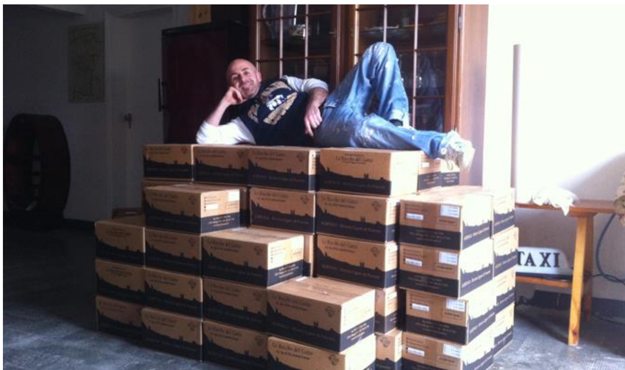
Capocordata in zona Reggio Emilia.

Al termine della cordata tutti gli ordini inseriti vengono pagati al prezzo finale raggiunto (ciascuno paga per la propria merce, il capocordata è solo il riferimento amministrativo per il gruppo poiché riceverà la fatturazione complessiva della merce). E' sufficiente una qualsiasi carta di credito o di debito, normale o ricaricabile, al momento Visa e Mastercard, in futuro è possibile che siano inseriti altri circuiti.